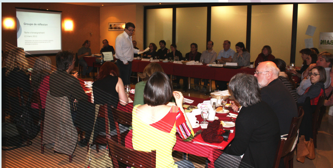
Groupe de discussion sur la tâche d'enseignement