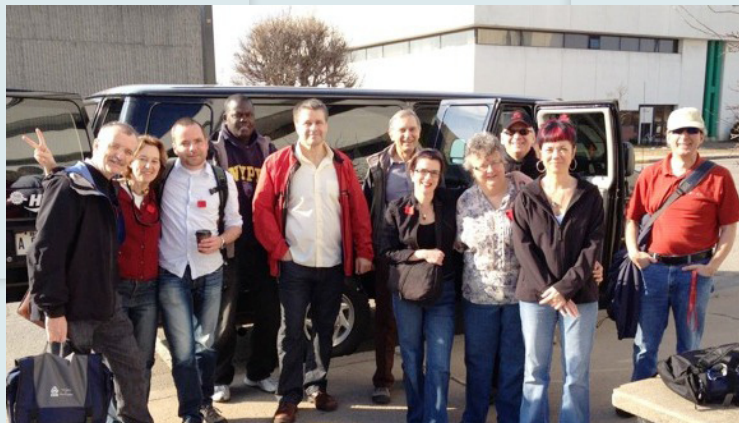
Délégation de professeurs et de chargés de cours à la manifestation du 22 mars à Montréal.

La question restera entière tant et aussi longtemps que la partie de bras de fer entre les étudiants et le gouvernement