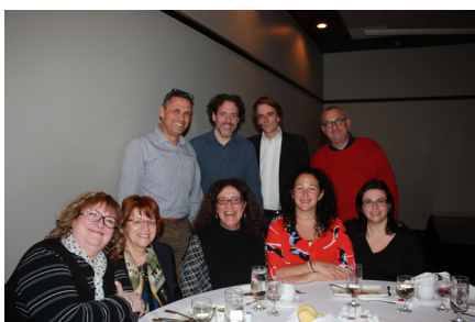
Souper thématique indien