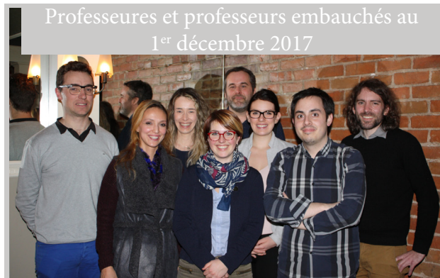
Professeures et professeurs embauchés au 1 er décembre 2017