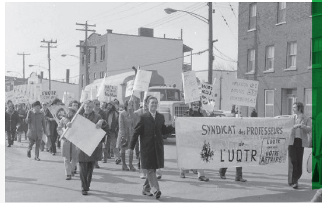
Manifestation des professeur.es de l'UQTR, rue Notre-Dame, centre-ville de Trois-Rivières. 18 mars 1975

On reconnaît au centre tenant la pancarte :