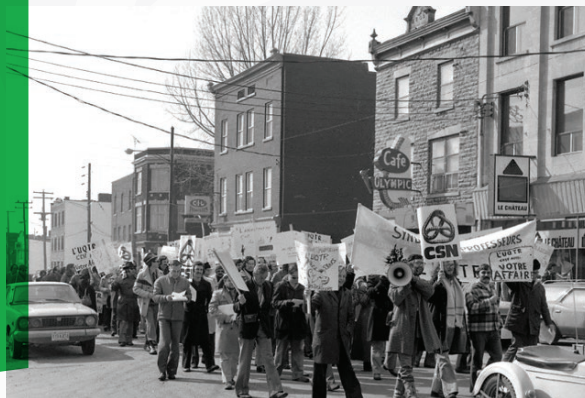
Manifestation des professeur.es de l'UQTR, rue Notre-Dame, centre-ville de Trois-Rivières. 18 mars 1975

Le 17 mars, le conseil syndical établit le calendrier des activités à réaliser les journées de grève : réunion d'information en début de journée, implantation de lignes de piquetage aux entrées du campus avant le début des cours, réunion du conseil syndical, tournée des classes pour s'assurer que les professeur.es ne donnent pas de cours, etc. 28 Le calendrier de la première semaine de grève se termine par l'annonce de la création d'une dizaine d'équipes, composées d'une dizaine de membres chacune, chargées du boycottage des cours et de l'obstruction des entrées des pavillons. 29