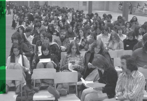
25 mars 1975

et de représentants des médias. L'assemblée doit voter sur la recommandation du conseil syndical d'expédier un avis de grève pour le 1 er avril prochain. Après avoir rejeté un amendement proposant de reporter l'avis au 15 août et d'attendre au premier avril pour décider s'il y aura grève ou non, les 150 professeur.es présents adoptent, à la suite d'un vote secret, la recommandation du conseil (101 pour / 44 contre / 4 bulletins rejetés). 31 Considérant le déroulement des négociations et la grève imminente, l'assemblée convient également de sursoir à l'élection des membres du comité exécutif et des délégués syndicaux et de prolonger leur mandat jusqu'à la signature de la convention collective.