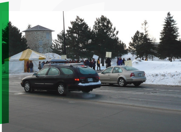
Entrée principale du campus universitaire rue Des Forges. Mars 2008

Le comité d'action syndicale a installé un chapiteau afin de réchauffer les piqueteurs et rencontrer les journalistes.