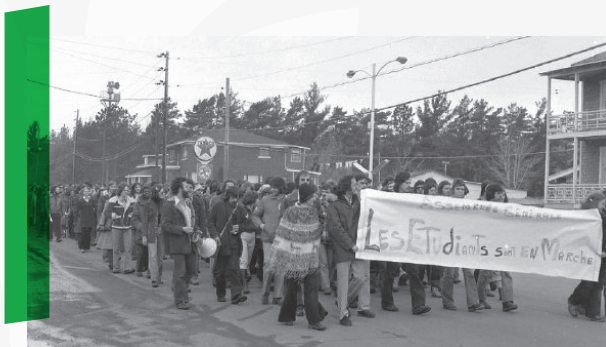
Manifestation des étudiant.es de l'UQTR, rue Des Forges, Trois-Rivières. 7 avril 1975

Afin de réduire le nombre de professeur.es présents sur la ligne de piquetage et les rendre ainsi moins étanches, en particulier pour permettre aux travailleurs de la construction de se rendre sur le chantier du Carrefour des médias (Pavillon Albert-Tessier), la direction demande une injonction à la Cour supérieure du Québec. L'ordonnance de la Cour émise par le juge Roger Laroche oblige également les grévistes à laisser passer les personnes qui souhaitent avoir accès à l'Université. Le Syndicat invite ses membres à respecter l'injonction. Le professeur Henri Wittmann, membre du comité de négociation, rapporte toutefois que les étudiants, eux, arrêtaient systématiquement les personnes que les professeur.es devaient laisser passer. 43 Le 7 avril, les étudiants organisent une deuxième marche dans les rues du centre-ville de Trois-Rivières afin de sensibiliser la population aux conséquences de la grève. 44