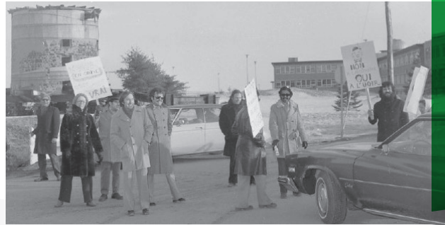
Ligne de piquetage à l'entrée de la rue Des Forges, Trois-Rivières. Mars 1975