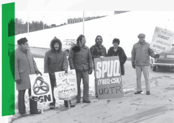
Ligne de piquetage à l'entrée des terrains du pavillon Michel-Sarrazin. Mars 1975